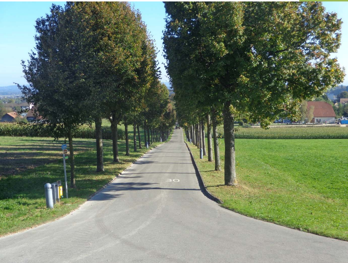
Allee vom Schloss weg